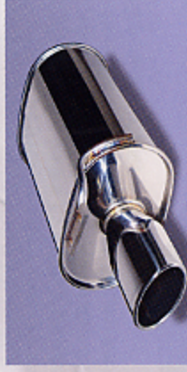
■オールステンレス・プラストIIマフラー (車検対応) (2WD用) (OR25DE、VO35DE) ¥54,000 80mm×120mmオーバル 排気効率を上げエンジンのトルク、レスポンスをアップさせる。質量は抑えめだが高回転時の高品位でスポーティーな音質は奔りのスピリットをかき立てる。

ストッピングパワーの確保はスポーツドライビングの必須条件。低速域から高速域までグイッと効くデータGは、日常車のストップ&ゴーを研ぎ尽くして生まれた。