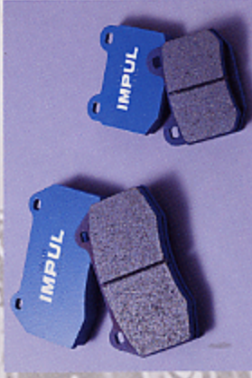
■DATA-G フレーキパッド(1台分) ¥30,000

ストッピングパワーの確保はスポーツドライビングの必須条件。低速域から高速域までグイッと効くデータGは、日常車のストップ&ゴーを研ぎ尽くして生まれた。