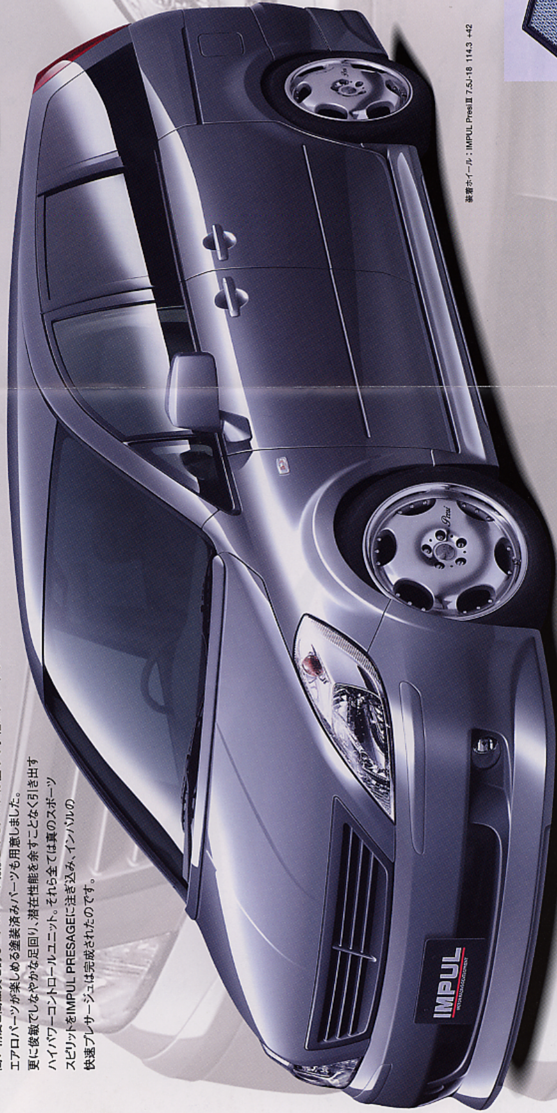
装着ホイール：IMPUL Presi II 7.5J-18 114.3 +42