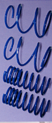
■インパルスポーツスプリング ¥96,000 / 1台分 (2WD用) [車検対応]

俊敏でありしなやかなというインパルの足回りに対する考え方を踏襲しつつ、ミニバンに不可欠な快適な乗り心地をも確保。快足ミニバンの足を安全に確実に快適に支える。