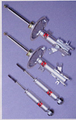
■インパルスーパーショックタイプ1 ¥78,000 / 1台分 (2WD用) [車検対応]

俊敏でありしなやかなというインパルの足回りに対する考え方を踏襲しつつ、ミニバンに不可欠な快適な乗り心地をも確保。快足ミニバンの足を安全に確実に快適に支える。