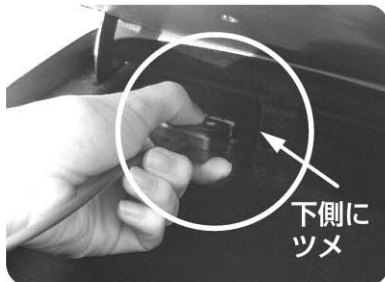
コネクタの拡大写真

コネクタの下面にツメがありますので、ツメを摘んでコネクタの抜き差しをしてください。特にコネクタをはずす場合はツメを強く摘まんでいただかないと抜けづらい場合があります。